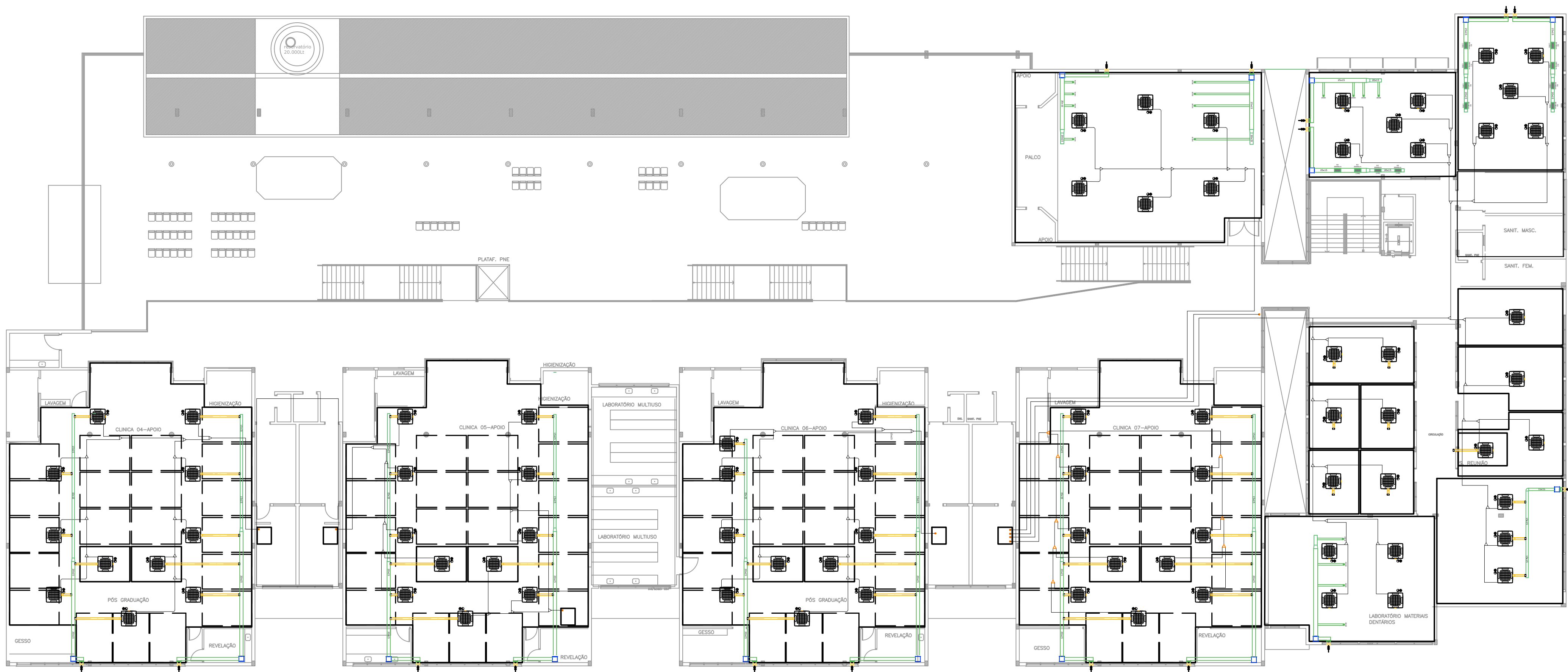
PLANTA BAIXA - PAVIMENTO 2

PARA MAIORES DETELHES, VERIFICAR O MEMORIAL DESCRIPTIVO DO PROJETO